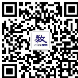
教师教学发展中心公众号